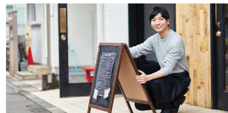
フロアが分かれた店舗などで